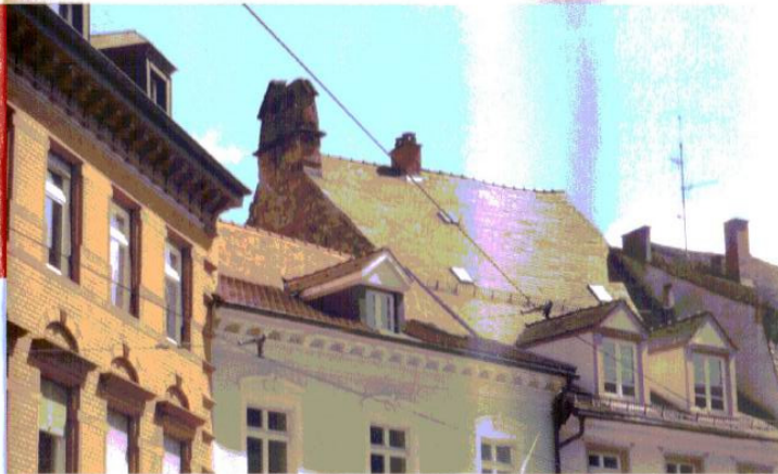
Von unten kaum sichtbar: Lücken im Ziegeldach des Antoniterhauses müssen schnell verschlossen werden.

Der Verein Denkmalpflege in Freiburg i. Br. e.V. setzt sich mit Unterstützung der Arbeitsgemeinschaft Freiburger Stadtbild e.V. dafür ein, das wertvolle Bauwerk in seinem Bestand zu sichern. Lücken im Ziegeldach müssen geschlossen, Glockenturm und Giebelwand gegen weiteren Verfall geschützt werden. Vor allem der Turm hat hohen historischen Wert: Die Antoniter riefen per Glockenschlag zum Gebet im unteren Kirchenraum des Hauses. Die Kosten der Erhaltungssicherung werden von Gutachtern auf 45.000 € bis 50.000 € geschätzt.