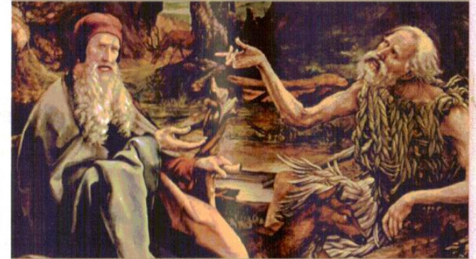
Der Isenheimer Altar von Matthias Grünewald: Im linken Flügel ist der Besuch des Hl. Antonius beim Eremiten Paulus von Theben zu sehen.

Die Antoniter nannten sich nach dem Einsiedlermönch in der ägyptischen Wüste, Antonius dem Großen, dessen Versuchungen durch Dämonen Matthias Grünewald auf dem Isenheimer Altar in Colmar dargestellt hat. Um 1100 bildete sich in Südfrankreich eine Laienbruderschaft zum freiwilligen Dienst an Kranken. Daraus entstand ein Hospitalorden. Um 1290 gründeten die Antoniter auch in Freiburg einen Konvent, das so genannte kleine Präzeptorat.