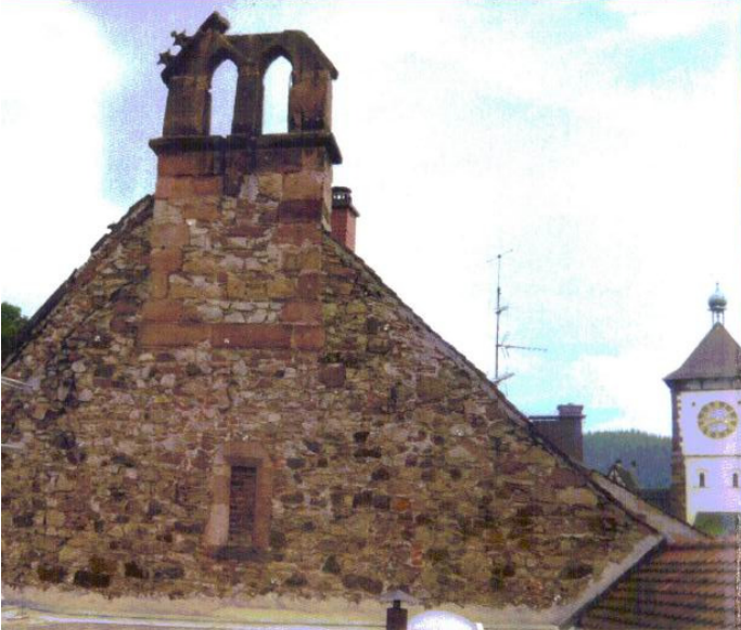
Mit Ihrer Spende kann der stark beschädigte Glockenstuhl endlich saniert werden.

Bitte spenden Sie jetzt für die Sanierung des Antoniterhauses und erhalten Sie mit uns ein Stück Freiburger Stadtgeschichte.